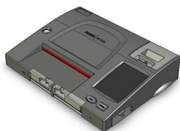
Machine à compilation ICP

Le superviseur du scrutin doit s'assurer que le rapport complet des résultats est retourné au bureau du directeur du scrutin avec la machine à compilation. L'agent de la machine à compilation des votes conserve la dernière (deuxième) section du rapport des résultats au cas où la machine serait abîmée au cours du trajet vers le bureau du directeur du scrutin.