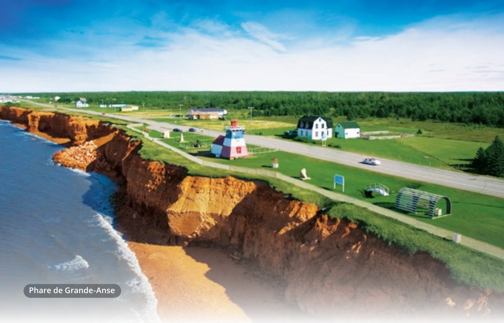
Phare de Grande-Anse