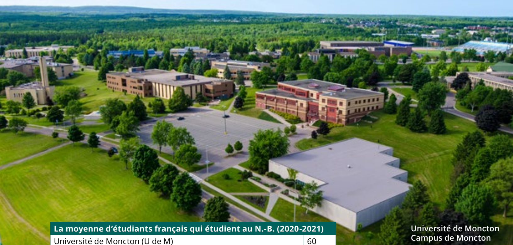
Université de Moncton Campus de Moncton