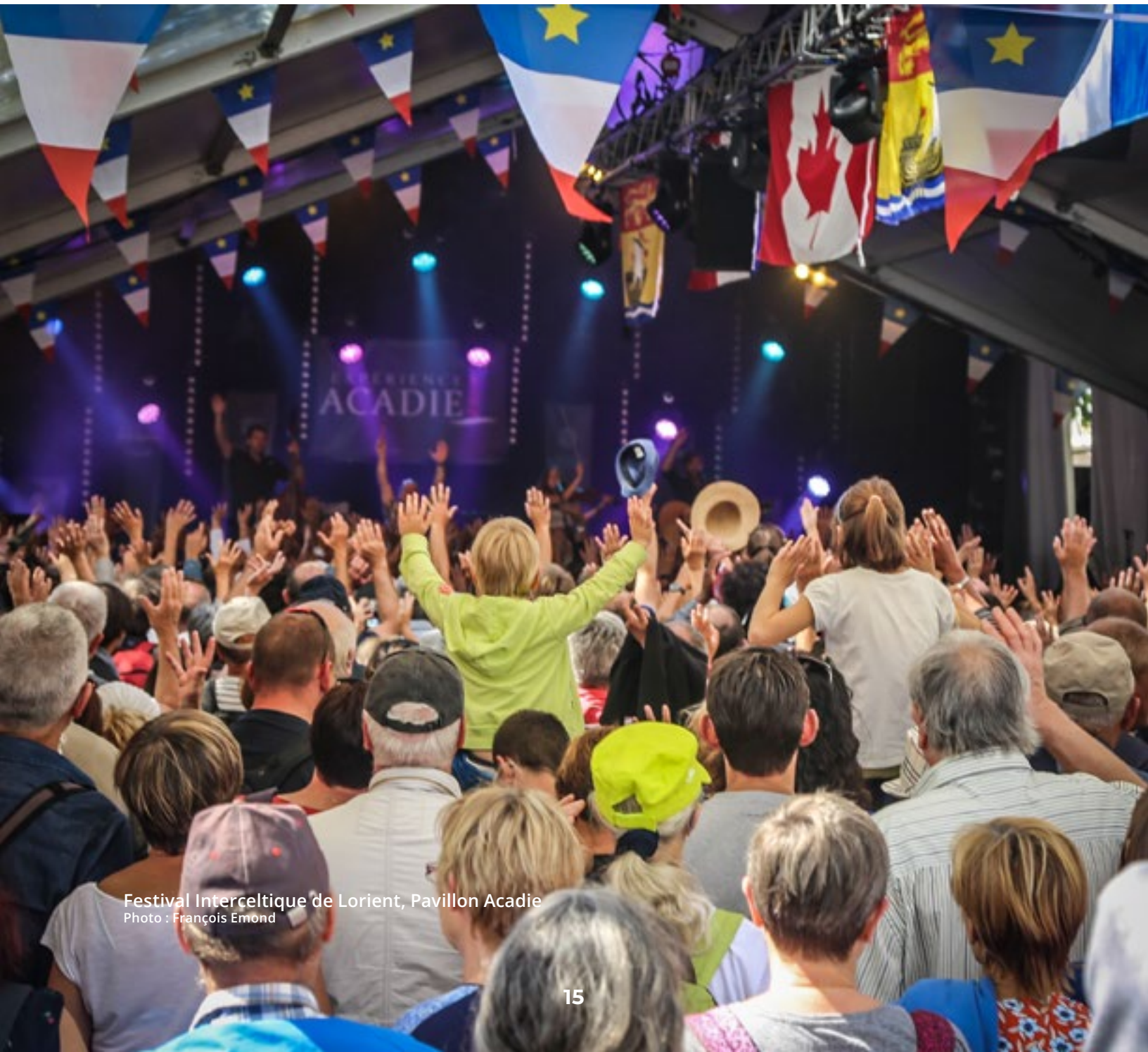
Festival Interceltique de Lorient, Pavillon Acadie

soutenant l'implication du secteur privé dans leurs régions par le biais d'échanges économiques et l'établissement de partenariats commerciaux; et en facilitant et en soutenant la promotion de la culture, afin de mieux promouvoir les avantages des relations culturelles, de la diversité et de la diplomatie.