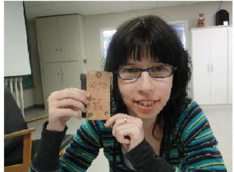
Dexter Centre Grand Falls