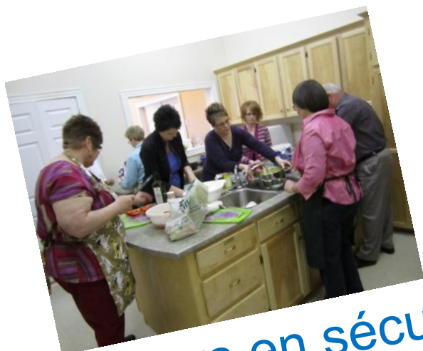
Mentors en sécurité alimentaire