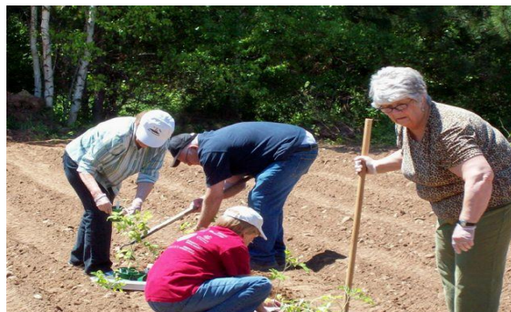
Renforcement des capacités