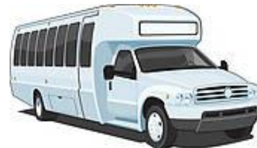
Options de transport