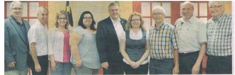
Des membres du Réseau d'inclusion de la Péninsule acadienne, à la suite d'une rencontre avec le premier ministre, David Alward, en 2012.