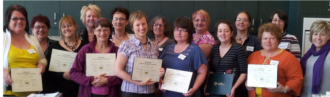
Mentors communautaires en alimentation