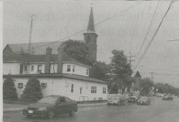
Il ne faut pas s'attendre à voir des autobus ou bécottilonner les rues des localités de Kent (ici, Acadie Nouvelle) de l'été. L'objectif est plutôt d'instaurer un système de partage rapide des taxis - Tricoups.

BY DIANE THOMPSON - Le service de transport en commun dans Kent pourrait être lancé dès l'été prochain. L'objectif est d'éviter l'exode des personnes du milieu rural vers les milieux où il y a plus d'accès.