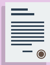
Lignes directrices pour l'histoire

Si vous avez des questions ou besoin de plus de renseignements ainsi que pour soumettre votre inscription, veuillez consulter le site: