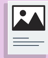
Lignes directrices pour l'affiche