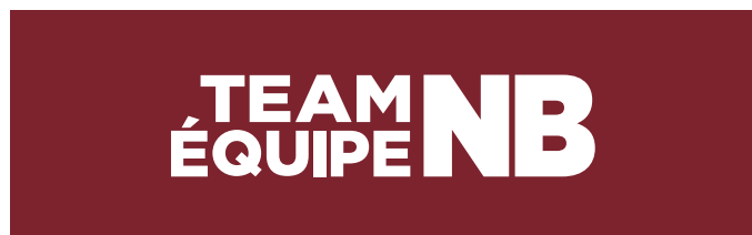
FOND SOMBRE UNI