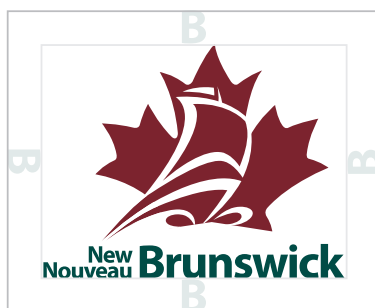
ESPACE LIBRE MINIMUM « B » À PARTIR DE « BRUNSWICK »