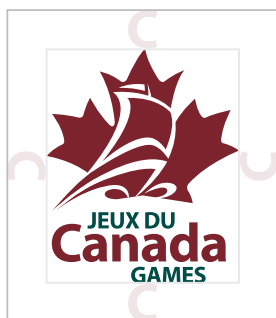
ESPACE LIBRE MINIMUM « C » À PARTIR DE « CANADA »