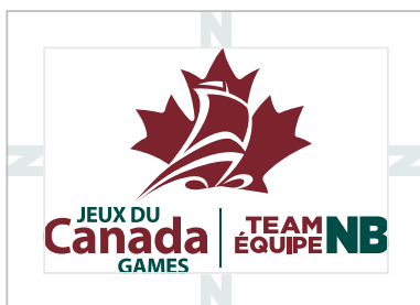
ESPACE LIBRE MINIMUM « N » À PARTIR DE « NB »