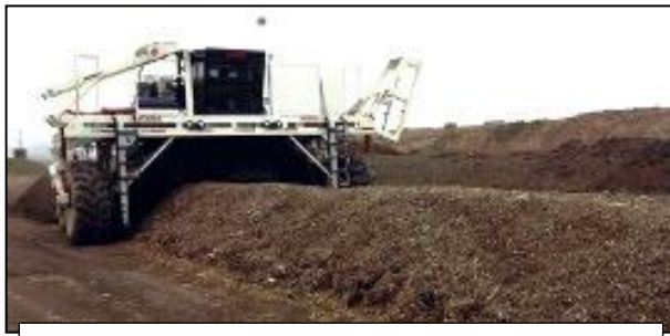
Figure 4 : Retourneur d'andains pour compost