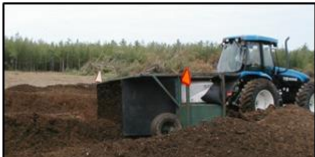
Figure 1 : Retourneur d'andains tiré par un tracteur

Cette fiche technique présente les informations, les méthodes et les recommandations pertinentes à l'intention des agriculteurs néo-brunswickois qui s'intéressent au compostage à la ferme.