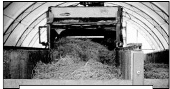
Figure 5 : Compostage en milieu