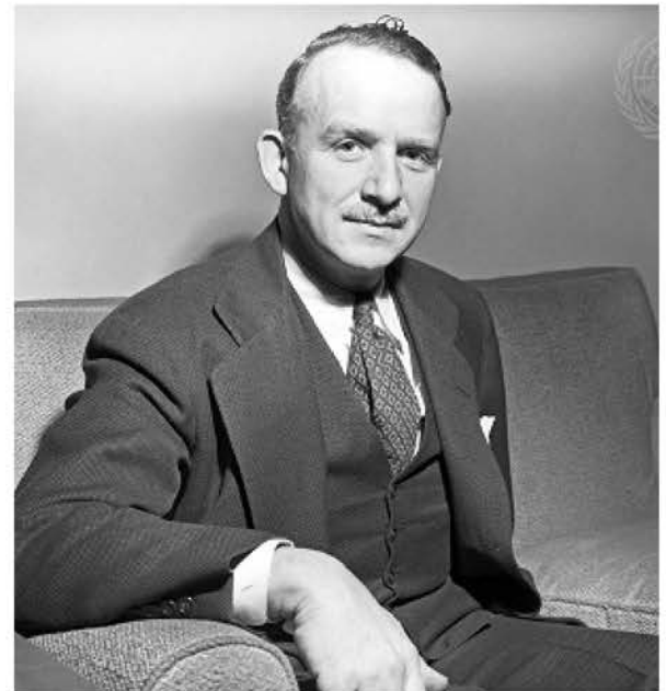
John Peters Humphrey, 1948

https://www2.gnb.ca/content/gnb/fr/ministeres/cdpnb/education-et-engagement/john-peters-humphrey.html