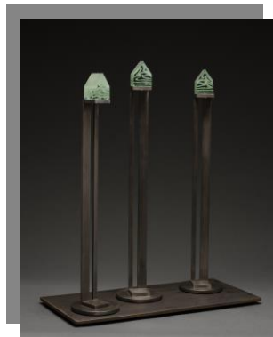
Elisabeth Marier, Maisonnettes (Houses) , 2013

*Selon la définition d'ArtsNB et du Conseil des arts du Canada