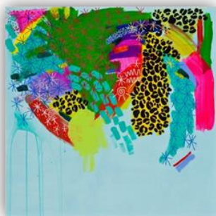
Jared Betts, #110 (N° 110), 2013