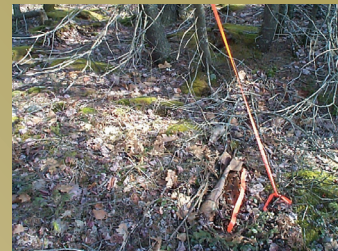
Comment marquer l'emplacement d'une munition

5. Signalez votre découverte. Appelez immédiatement la GRC au (506) 393-3000 (numéro accessible 24 heures sur 24). La GRC est responsable de vérifier et d'éliminer comme il se doit les objets suspects. Vous NE DEVEZ PAS décider vous-même si quelque chose est dangereux ou non.