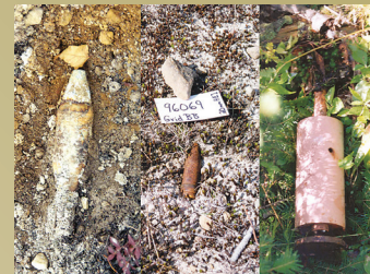
Munitions trouvées sur le site

Les munitions peuvent être partiellement ou entièrement enfouies dans le sol, ce qui rend leur repérage difficile. Elles peuvent également être recouvertes de neige ou de végétation. Les munitions ont plusieurs formes et plusieurs dimensions, depuis les balles de petite taille aux pièces de mortiers ou aux bombes.